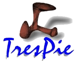
Ilustración de portada: Natalia Chás. Fotocomposición: TresDie .